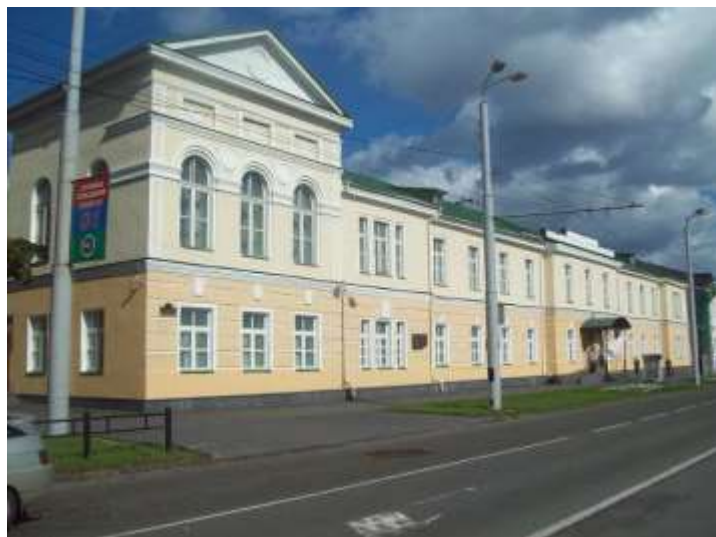
Музей изобразительных Искусств Республики Карелия